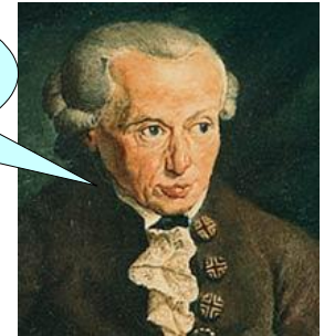
Immanuel Kant 1724-1804

Man darf nicht lügen! Auch nicht in Notsituationen!